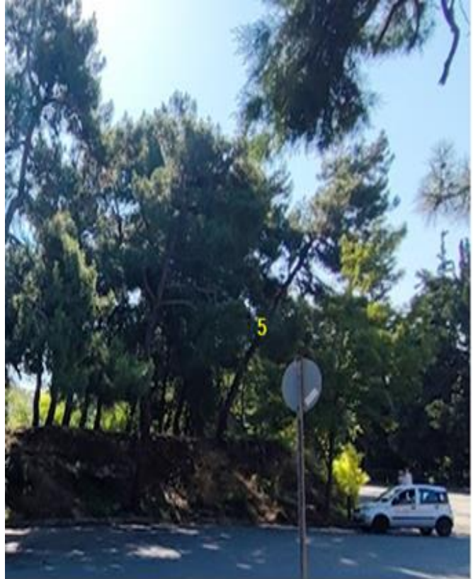
ΦΩΤΟ 6 (ΔΕΝΔΡΟ 5)