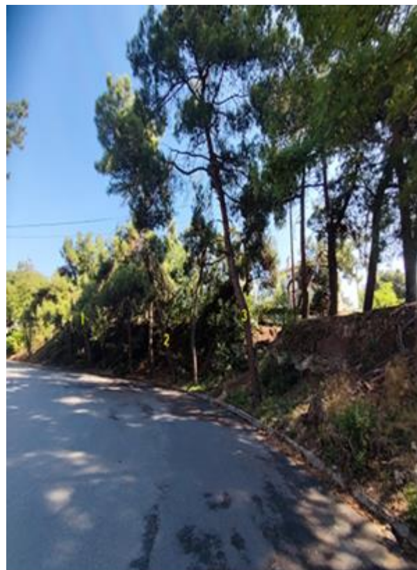
ΦΩΤΟ 3 (ΔΕΝΔΡΟ 3)