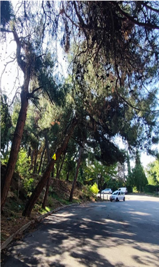
ΦΩΤΟ 5 (ΔΕΝΔΡΟ 4)