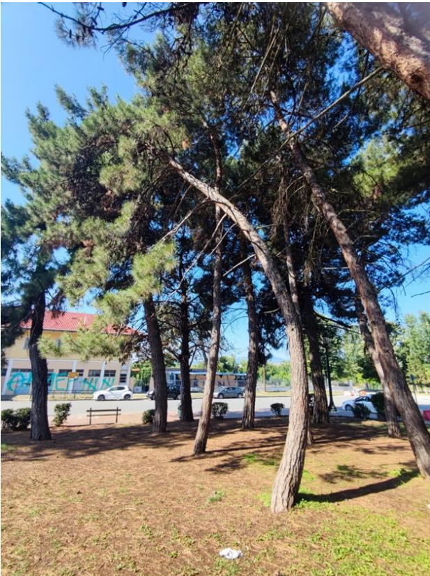
ΦΩΤΟ 7 (ΔΕΝΔΡΟ 6- ΑΠΕΝΑΝΤΙ ΣΤΟ ΠΑΡΚΟ)